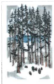
8. LES FUVES