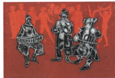
6. LES CLOWNS