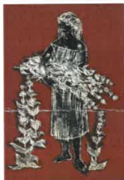
7. FILLE A LA GENTIANE