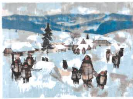
4. JEUX D'HIVER A CHANTEGRUE