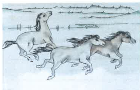
11. CHEVAUX A LA NEIGE