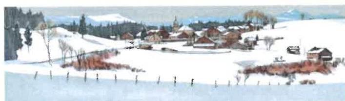
14. LES BOUCHOUX