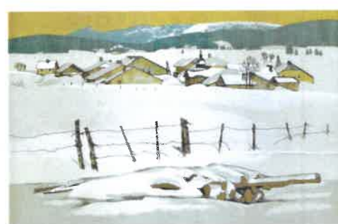
10. HIVER AU CROUZET