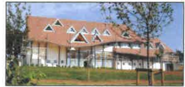
LA MAISON DE FAMILLES

f Semons L'Espoir - Maison des Familles de Besançon