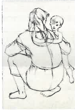
9. LA MATERNITE