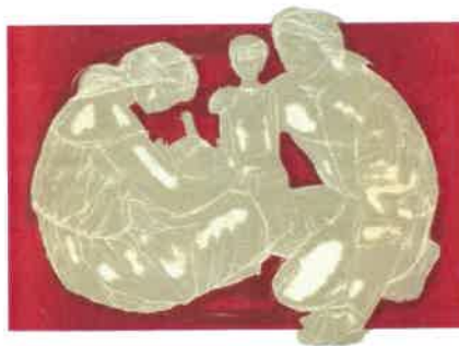
12. LA FAMILLE II