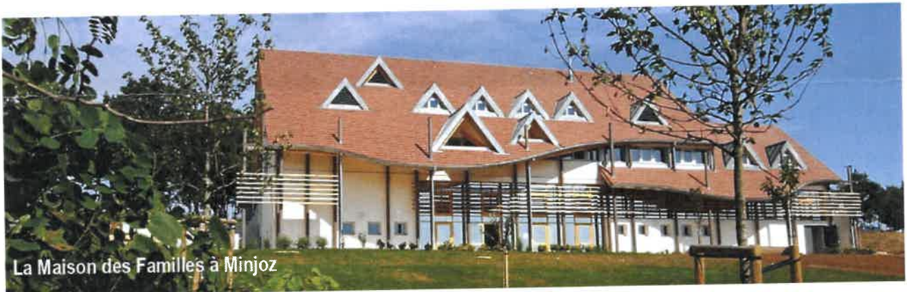
La Maison des Familles à Minjoz

La maladie représente un traumatisme et une rupture avec la vie normale, la Maison des Familles permet la présence des proches à proximité de l'hôpital. Lieu d'hébergement et de soutien, lieu de vie et de rencontre, la Maison des Parents de St Jacques, accueillait près de 1000 familles d'enfants malades, issues majoritairement des 4 départements francs-comtois mais aussi de régions plus éloignées.