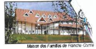
Maison des Familles de Franche-Comté

Choisir les cartes de Semons l'Espoir pour vos vœux, c'est aider les enfants malades hospitalisés en Franche-Comté et soutenir la Maison des Familles à l'hôpital Minjoz.