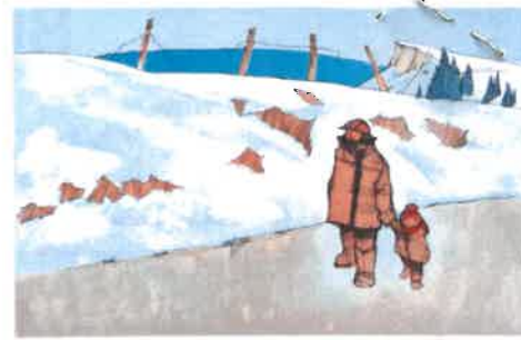
3. LE TALUS