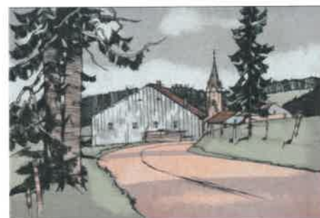
13. LES PONTETS